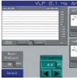
0.1 Hz VLF test