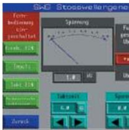
Surge generator with GSM-remote-c